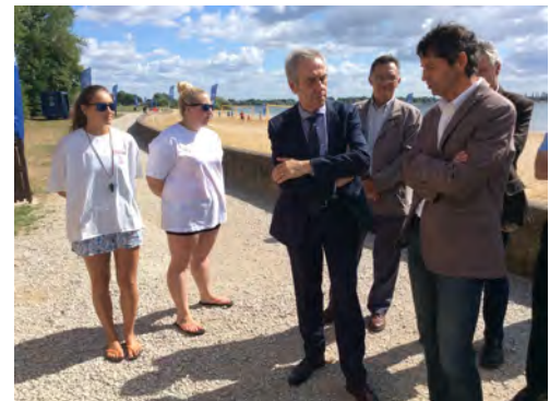
Été 2015, Lac du Der, contrôle de capacité des surveillants de baignade